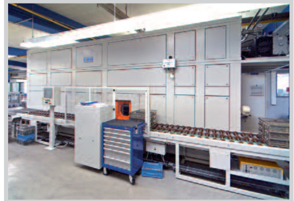
Sonderausführung mit vier Fluttanks (Korbgröße Schäfer 1)

Reinigungs- und Entfettungsanlagen für wässrige Medien, CKW- und Kohlenwasserstoff-Lösemittel.