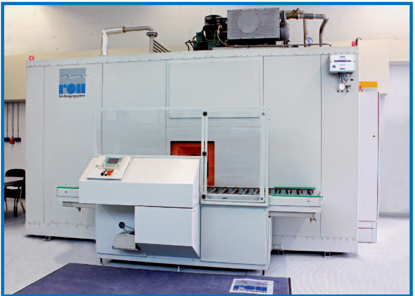
Reinigungsanlage für Standardanwendungen