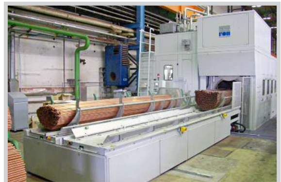
Sonderanlage zur Reinigung von Rohren bis 6 m Länge