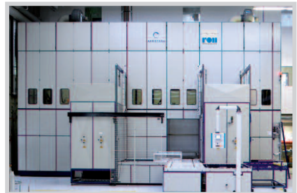
Sonderanlage für Körbe 1400 x 1100 x 1500 mm