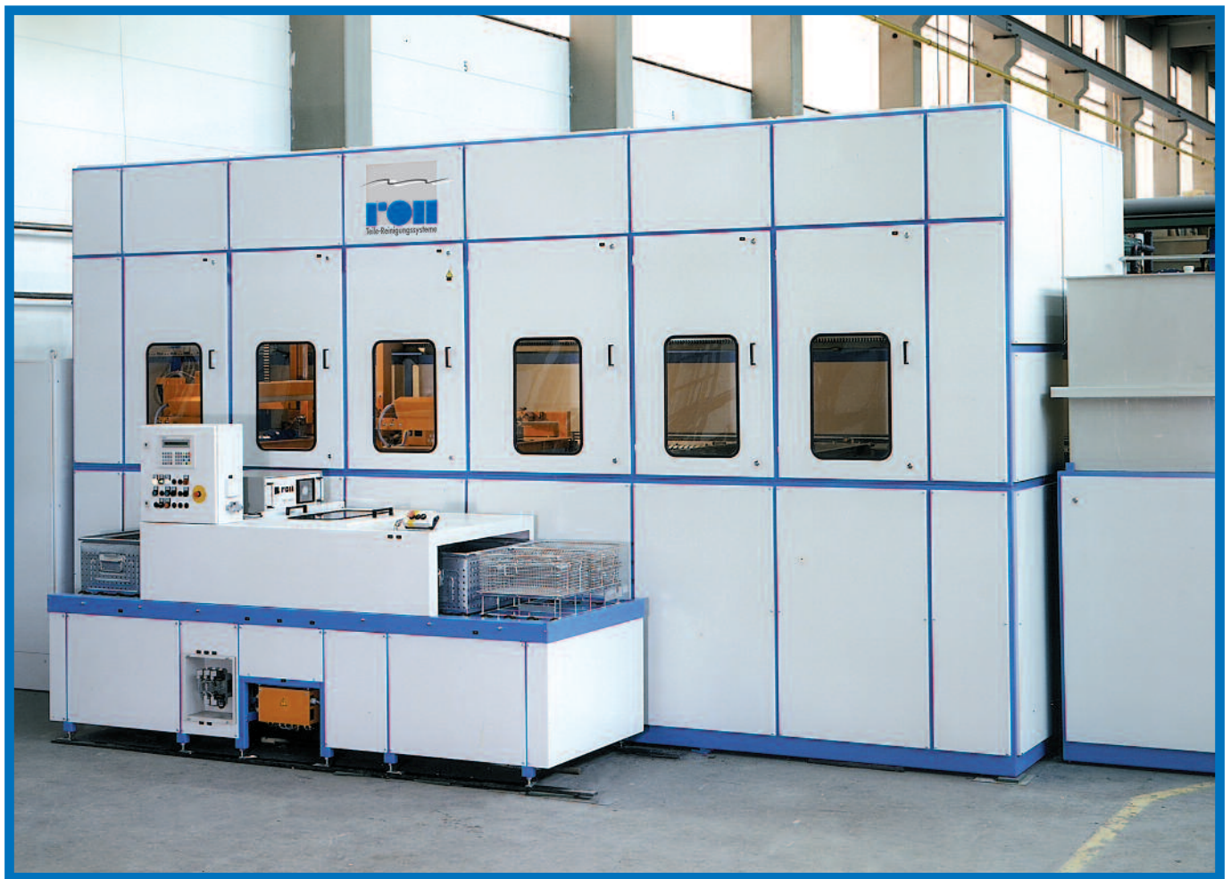
Mehrkommer-Tauchanlage mit mehreren Warenträgern