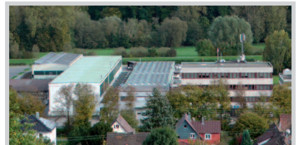
Betriebsgelände im Enztal