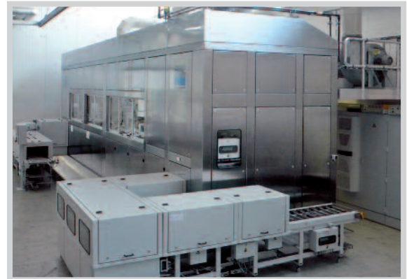
Vollingehauste Reinigungsanlage im Reinraum

Die Badaufbereitung erfolgt je nach Anforderung über Filter zur Partikelabscheidung, Ölabscheider zur Pflege des Reinigungsbadens und Verdampfer oder VE-Kreislaufanlagen zur Spülbadpflege.