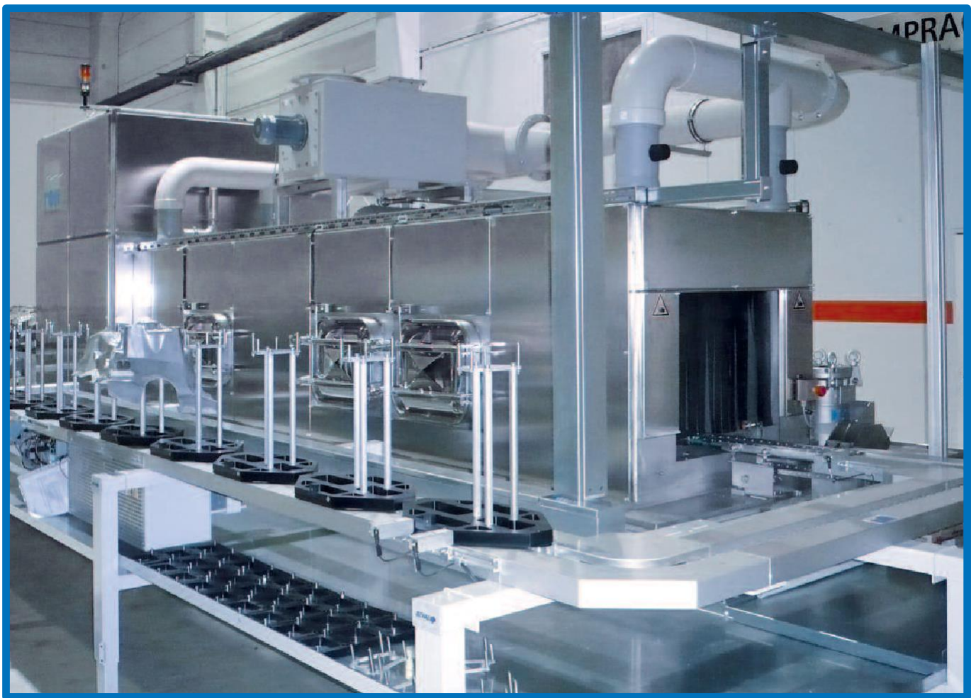
带零件输送装置的通过式喷淋设备