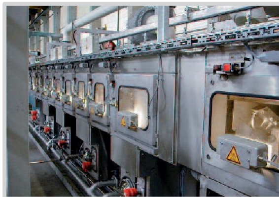
通过式喷淋清洗设备的实物近照

根据需要，使用过滤器进行颗粒分离，油水分离器维持槽液状态，蒸发器或完全的除盐再循环设施作为漂洗槽净化的一部分。