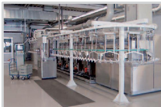
带悬挂输送机的通过式喷淋清洗设备